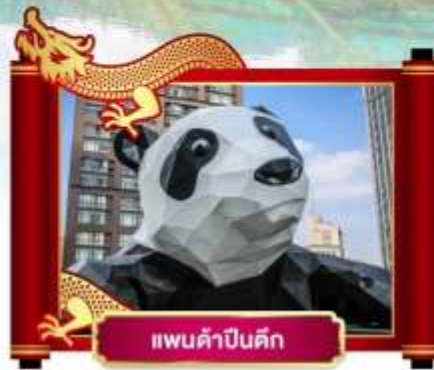
แพนด้าปิ่นตึก